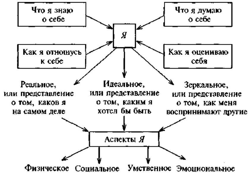
Рис. 2. Структура Я-концепции

Основу Я-концепции, ее содержание составляют знания о себе, своеобразная картина собственной личности. Например, человек говорит о себе: я умный, общительный, немного эгоцентричный, внимательный, приятной наружности и т.д. На эту «картину» тут же накладывается отношение. Например: в целом я собой удовлетворен и принимаю себя таким, какой есть, - высокое самоуважение. Возможны варианты, например: удовлетворен своими способностями, но не удовлетворен внешностью, и т.п.